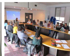
Echanges sur le rôle des associations dans la mise en place des essais