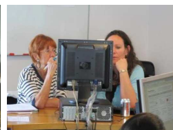
Atelier de recherche d'information sur le web