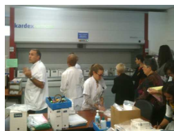
Visite de la pharmacie et du CIC de la Timone

Note globale : 16,7/20 (pour 2014) et 17,2/20 (pour 2015)